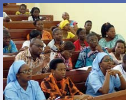
Małżeństwo i rodzina to nie tylko uczucia – potrzebna jest też duża wiedza na ten temat

z tego, że encyklika ta zawiera w sobie hymn na cześć „szczególnej formy przyjaźni”, jaką jest małżeństwo, i bynajmniej nie unika problemu regulacji urodzeń, lecz i w tym wymiarze ukazuje sposoby osiągnięcia szczęścia małżeńskiego i rodzinnego? Popierane przez Pawła VI i jego następców, zwłaszcza świętego Jana Pawła II, badania w tej dziedzinie stanowią naturalny element zdrowego duszpasterstwa rodzin. Alternatywą jest perwersyjna etyka, hołdująca egoizmowi jednostki i żądzy zysku wielu gałęzi przemysłu. Celem symposium jest dostrzeżenie tych powiązań i poszukiwanie na nie odpowie-