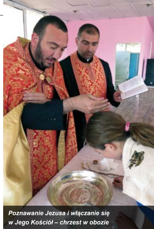
Poznanie Jezusa i włączanie się w Jego Kościół – chrzest w obozie

tak na przykład podczas letnich obozów Kościoła ormiańskokatolickiego w Armenii, Gruzji, Rosji i Europie Wschodniej. W tym roku weźmie w nich udział osiemset dzieci i młodych ludzi w wieku od dziewięciu do osiemnastu lat. Rodzice mogą być pewni, że dzieci spędzą czas zgodnie z wartościami chrześcijańskimi, a ponadto dowiedzą się dużo o swojej duchowej ojczyźnie, Kościele katolickim obrządku ormiańskiego. Obok codzien-