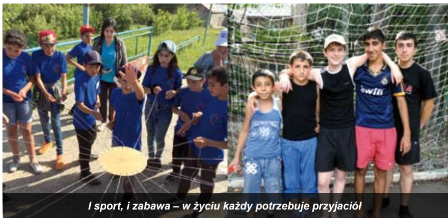
I sport, i zabawa – w życiu każdy potrzebuje przyjaciół

Dzieci pochodzą z ubogich rodzin i nie mają innych okazji, by w ten sposób spędzać wakacje. Podczas obozów wiele z nich przyjmuje chrzest – w zeszłym roku było ich dwadzieścioro pięcioro. Inne wraz z katechetami i kapłanami przygotowują się do pierwszej Komunii świętej. Trudno o więcej dobra dla dzieci. Pomagamy im kwotą 100 000 zł. •