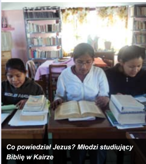
Co powiedział Jezus? Młodzi studiujący Biblię w Kairze

W oczach umiarkowanych muzułmanów chrześcijanie należą do „ludów Księgi”. Biblia to element ich tożsamości.