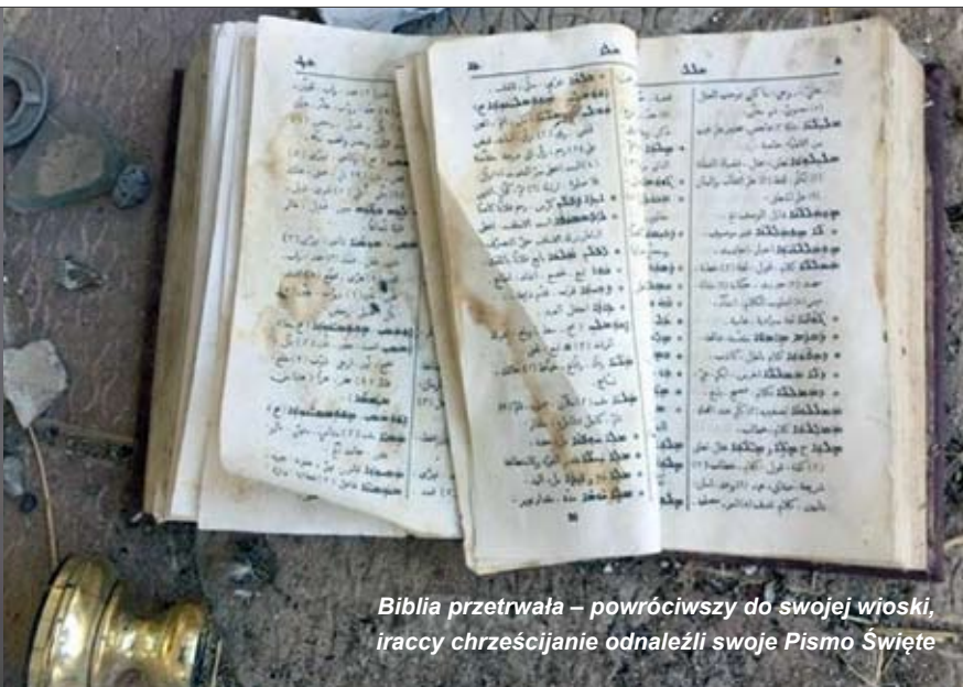
Biblia przetrwała – powróciwszy do swojej wioski, iraccy chrześcijanie odnaleźli swoje Pismo Święte

Papież Franciszek, Przedmowa do Biblii YOUCAT