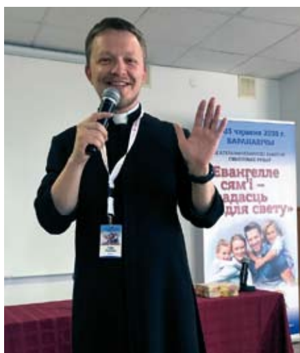
I świeccy, i księża – Kościół na Białorusi działa na rzecz umocnienia rodziny

wać w wioskach i miastach katolicką naukę o rodzinie – „arcydziele Boga” (papież Franciszek). Wspieramy te starania kwotą 26 000 zł rocznie.