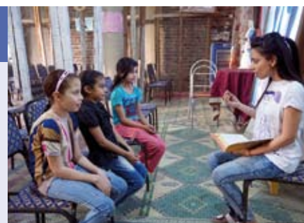
Co tu powiedział Jezus? Uczą się, aby dawać świadectwo wierze

do osiemnastu lat. Wszyscy otrzymają do nauki Biblię – w centrum znajdzie się Nowy Testament. Na pierwszy ogień pójdzie Ewangelia św. Mateusza, a potem kolejno Marka, Łukasza i Jana. Zainteresowanie jest olbrzymie. We wrześniu, tuż przed rozpoczęciem nowego roku szkolnego, podczas długiego wspólnego weekendu finaliści udowodnią swoją znajomość życia Jezusa i Dobrej Nowiny. Książki, organizacja imprezy, a przede wszystkim zakwaterowanie uczestników to jednak koszty, których ubogie koptyjskie para-