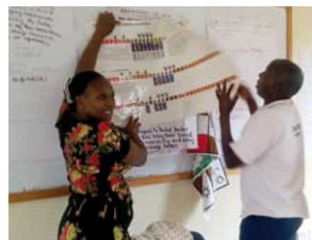
Zjednoczeni w walce z AIDS i o szczęście małżonków w Kenii