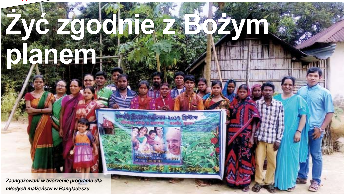
Zaangażowani w tworzenie programu dla młodych małżeństw w Bangladeszu

„Sam Bóg jest twórcą małżeństwa” – czytamy w konstytucji Gaudium et Spes (1965), a Benedykt XVI nauczał: „Małżeństwo nie jest wymysłem Kościoła; jest rzeczywistość «współ-stworzone» z człowiekiem jako takim, jako owoc dynamiki miłości, w której mężczyzna i kobieta odnajdują się nawzajem i tym samym odnajdują również Stwórcę, który ich powołał do miłości”.