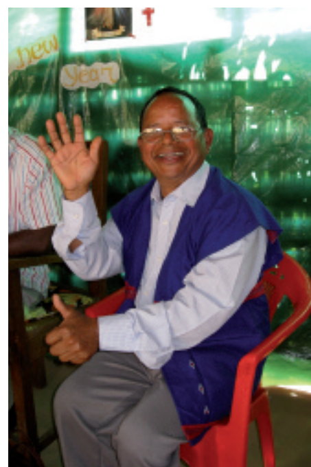
W jego wiosce w Indiach nie ma kaplicy, zabrał się więc sam do budowy