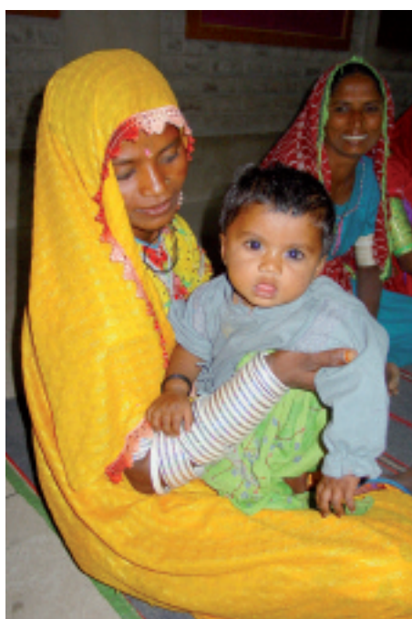
Programy dla kobiet w Pakistanie afirmują ich godność

Ewangelizacja ma wiele twarzy. Jest sprawą życia i śmierci, nie tylko w krajach najuboższych. Także u nas istnieją wewnętrzne pustynie. I także tu możemy ofiarować innym Wodę Życia. ●