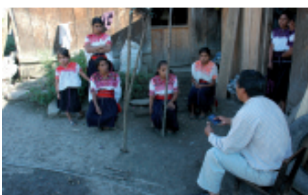
Program św. Pawła w Meksyku ma na celu ewangelizację indiańskiej ludności